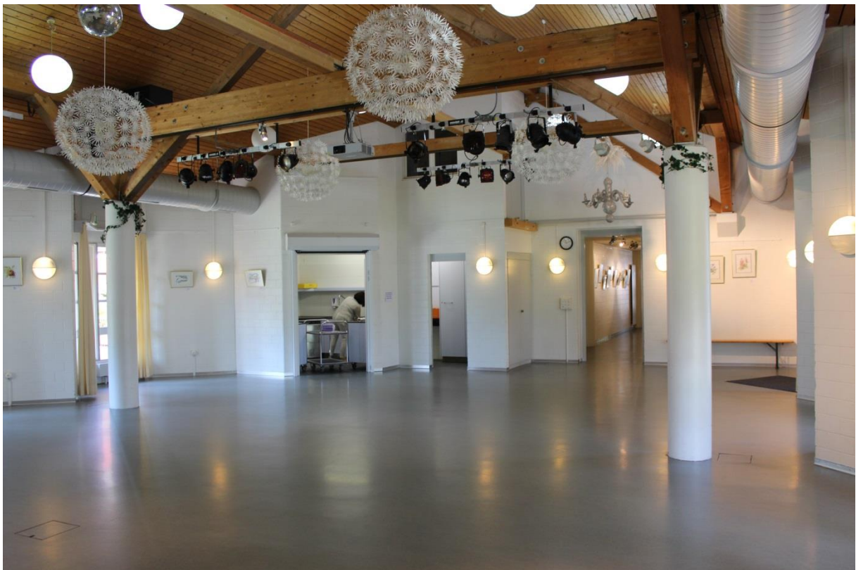
Grosser Saal mit Küche für Apéro: Gläser, Geschirr, Besteck und Stühle für 100 Personen und Tische