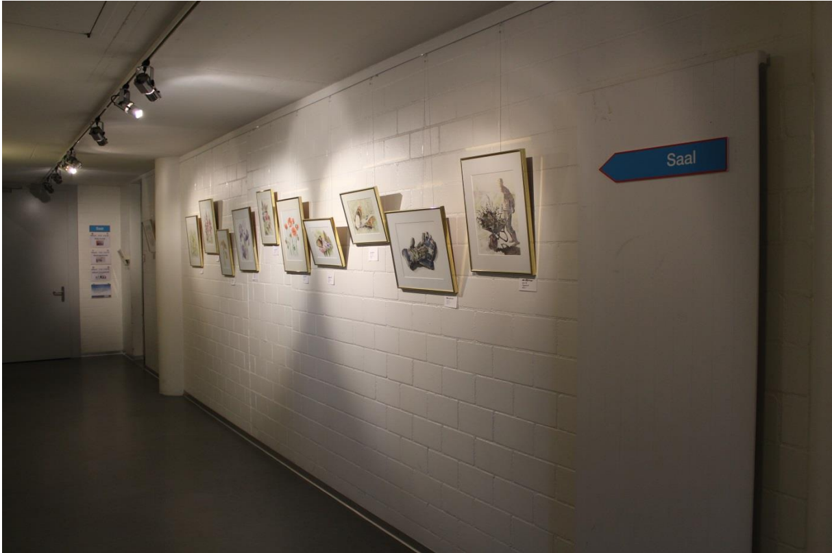
Gang zum grossen Saal